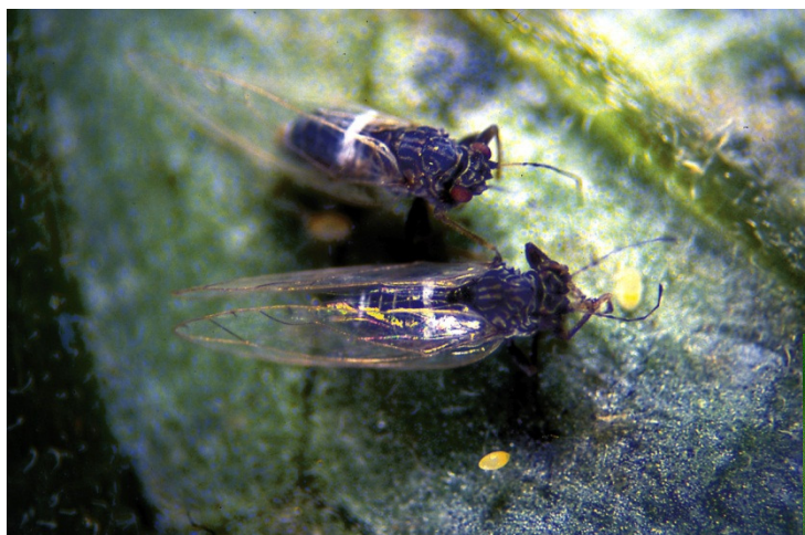
פסילת העגבנייה ותפוח האדמה