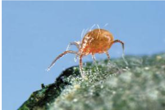
אקרית הפרסימיליס - נקבה בוגרת