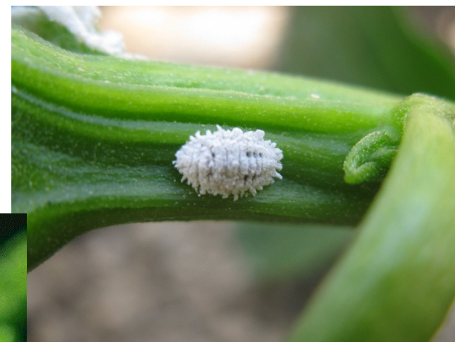
קמחית מנוקדת (כבר כאן)