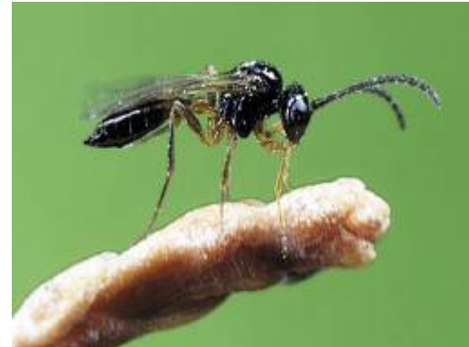
צירעת האפידיוס - פרט בוגר