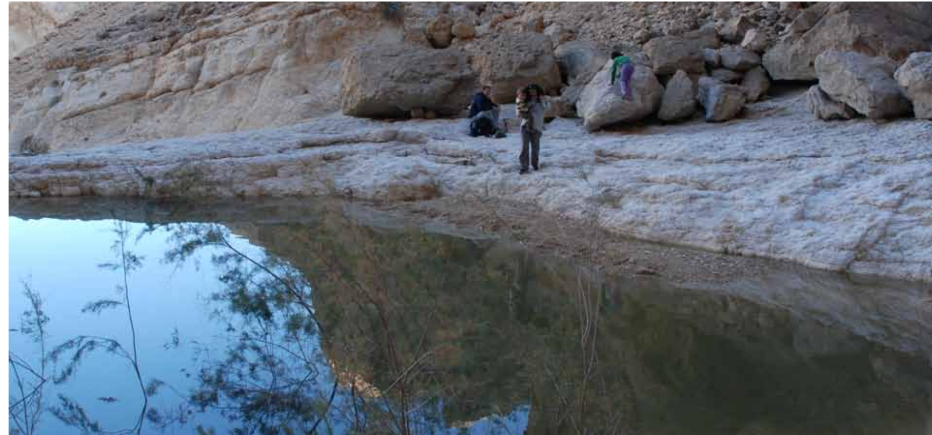
נחל נקרות - גב חולית

לאחר שנחתם הסכם השלום עם ירדן ב-1994 סללה הקרן הקימת לישראל את דרך הפטרולים שממערב לנחל ערבה וקראה לה "דרך השלום". הדרך יוצאת משער הכניסה של מושב עידן ועוברת