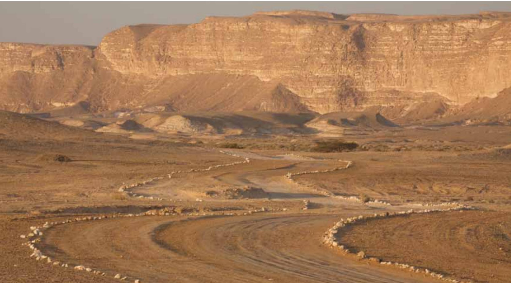
מישור הערבה וצוקי חדוד בדרך לקניון ברק