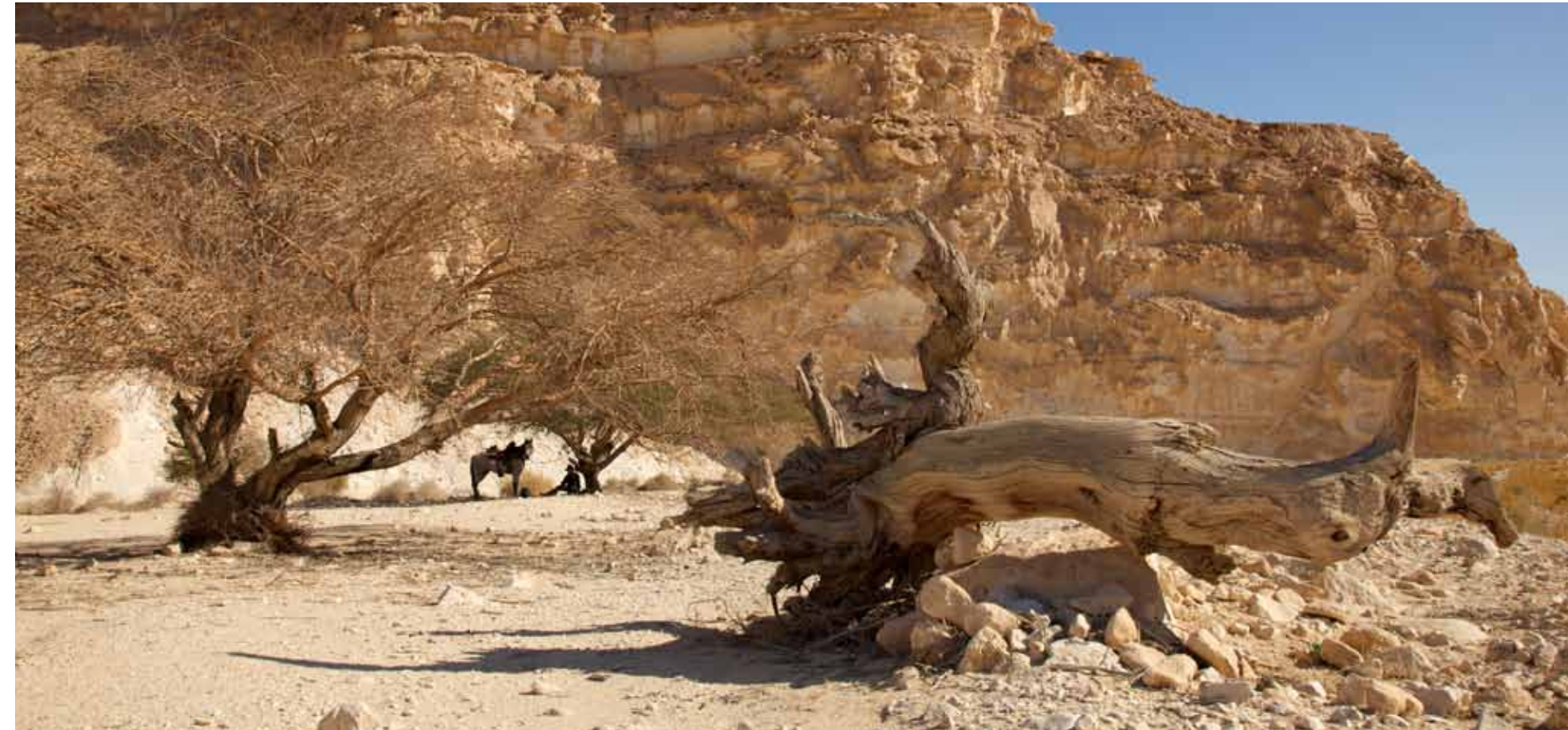
טיולי ג'יפים בערבה