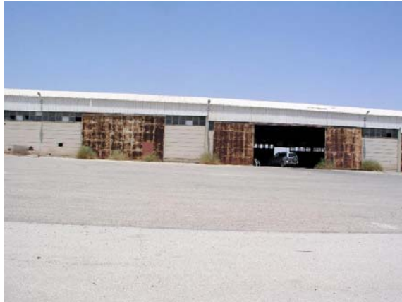
מבט חיצוני - פאה דר', מגרש חנייה גדול