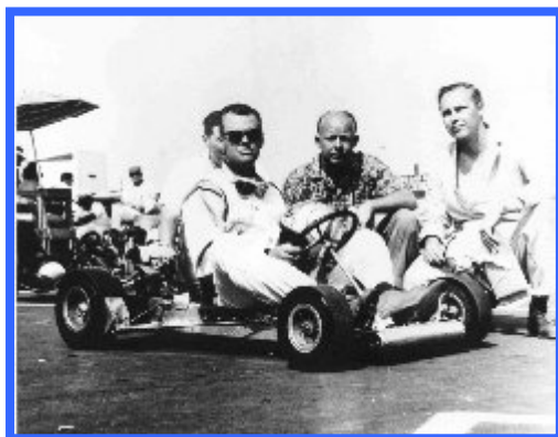
ראשיתו של הקארט

ראשיתו של הקארט בשנות ה-50 של המאה הקודמת בארה"ב (קליפורניה). הקארטים הראשונים נבנו