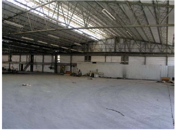
מבט לתוך המבנה – פאה מז'