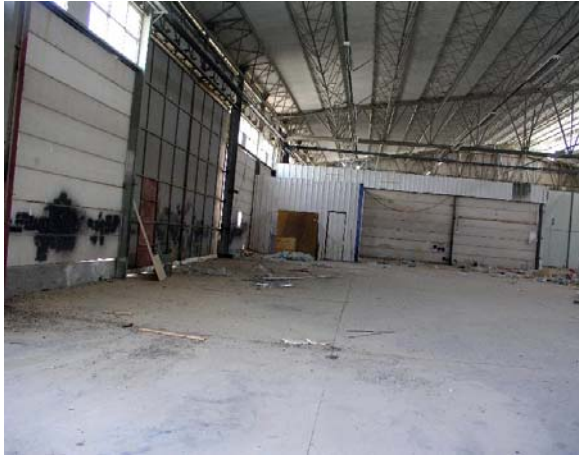
מבט לתוך המבנה – פינה דר' מז'