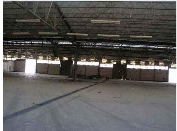
מבט לתוך המבנה פאה – צפ'